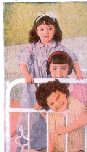
La limosna que me hicisteis, ya los ángeles también la tienen asentada en el cielo, en el libro de la vida.

pero para ello necesitamos tu ayuda. Un pequeño sacrificio en estas Pascuas permitirá que 2.173 niñas vivan con la ilusión de correr alegres y sanas como los niños.