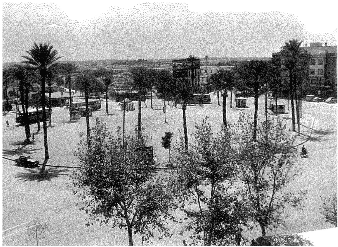
La Gran Plaza, en la década de los años sesenta, y los Hermanos con niños en la playa