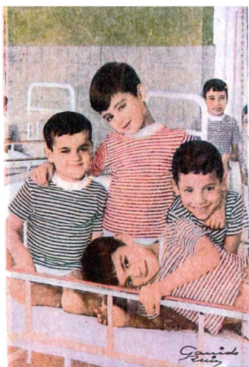
(SAN JUAN DE DIOS)

1961. El día de San Juan de Dios por la tarde, visita del Cardenal y confirmación de 50 niños del Sanatorio. Se inaugura el escenario, al final de las dos galerías, que estrenan los empleados con el gracioso sainete: "La casa de campo". Con la recaudación del "Rodeo americano", la Base de Morón dona el gabinete de Odontología. Se obsequia a la Parroquia de San Bartolomé una imagen del Beato Juan Grande. En agosto empiezan las obras del pabellón de las niñas (planta baja de Santa Teresa) y, sobre la cocina, un nuevo piso en el martillo, para hacer la clausura de las Hermanas.